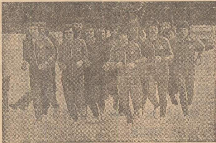
Dinamoviștii, într-o secvență de pregătire fizică cotidiană.