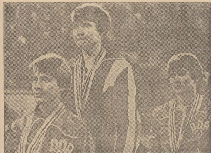
Ludmila Kondratieva pe cea mai înaltă treaptă a podiumului olimpic la 100 m, încadrată de Marlies Göhr și Ingrid Auerwald.