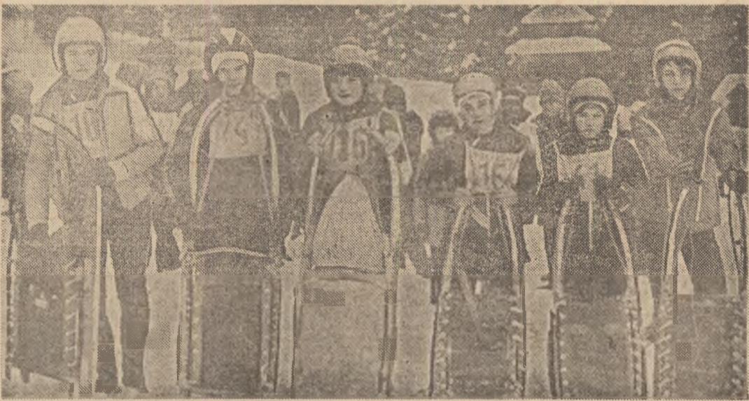
Fruntașii întrecerii, în fața obiectivului fotografic, după prima manșă