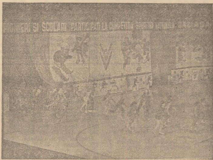
În arena artiștilor gheții intră alaiul vesel și bogat colorat al proaspetilor laureați, la toate categoriile de vîrstă.

Cei peste 100 de boberi și sînieri, împreună cu antrenorii lor, și-au exprimat și cu acest prilej hotărîrea de a-și ridica necontenit măiestria sportivă, contribuind — astfel — la ridicarea prestigiului sportului românesc și au aplaudat — în cadrul premierilor — pe cei mai buni dintre ei. Apoi au asistat, cu emoție, la coborirea drapelului marilor competiții naționale „Daciada”.