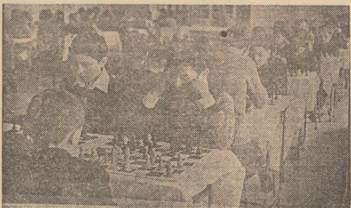
Secvență din întrecerea finală a șahiștilor, categoria 11—14 ani. Loc de desfășurare — Casa de cultură a sindicatelor