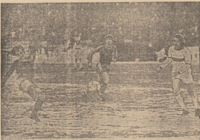
Mingea pornită din piciorul lui Zahiu se va opri în plasă. A fost golul cu care Steaua a deschis, sîmbătă, scorul în meciul disputat de ea în compania echipei S.C. Bacău.

Repriza s-a încheiat cu o altă mare ratare a lui Iordănescu (min. 45), dar, la patru minute de la reluare, a fost rindul lui Iordache să intervină salutar la