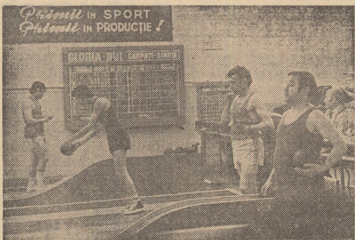
Un aspect din jocul ultimelor două schimburi, în meciul Gloria București — Carpați Sinaia

A. SZABO -coresp. ● VOINȚA GALAȚI — GLORIA BUCUREȘTI 2449 — 2353 (4-2) ● PETROLUL BĂICOI — VOINȚA PLOIEȘTI 2384 — 2237 (6-0) ● CARPAȚI SINAIA — VOINȚA BUCUREȘTI 2269 — 2363 (1-5) ● VOINȚA CRAIOVA — HIDROMECANICA BRAȘOV 2279 — 2406 (1-5) ● VOINȚA ORADEA — C.S.M. REȘIȚA 2361 — 2340 (4-2).