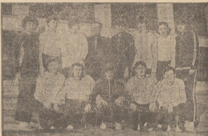
Echipa Universitatea Cluj-Napoca, noua campioană a țării la baschet feminin.

În pag. 2-3 amănunte de la meciurile etapei 19-a a Diviziei „A”.