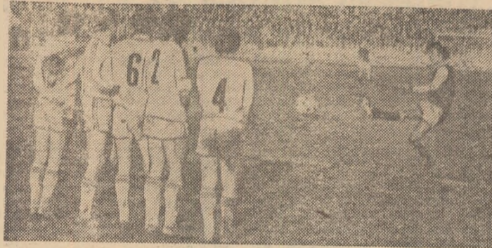
Minutul 72 al partidei F.C.M. Brașov - F.C. Baia Mare: Bucur a executat bine lovitură de la marginea careului și va marca al doilea gol al gazdelor.