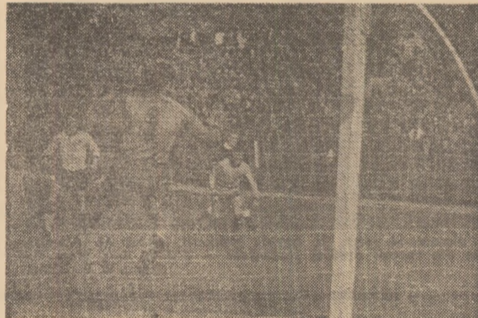
Marica a șutat impecabil, marcînd golul victoriei în meciul Progresul Vulcan — Jiul 1—0.