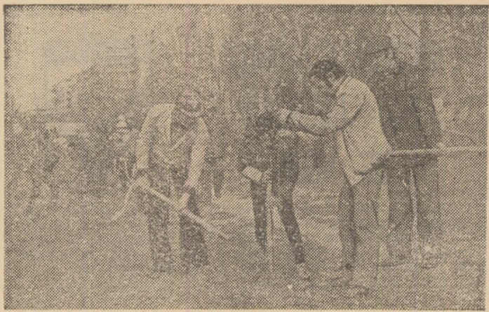
Ieri, pe stadionul „Olimpia”, o întrecere entuziastă: „nici o palmă de pământ nefolosită”.