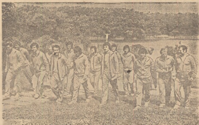
Tricolorii după antrenamentul de ieri