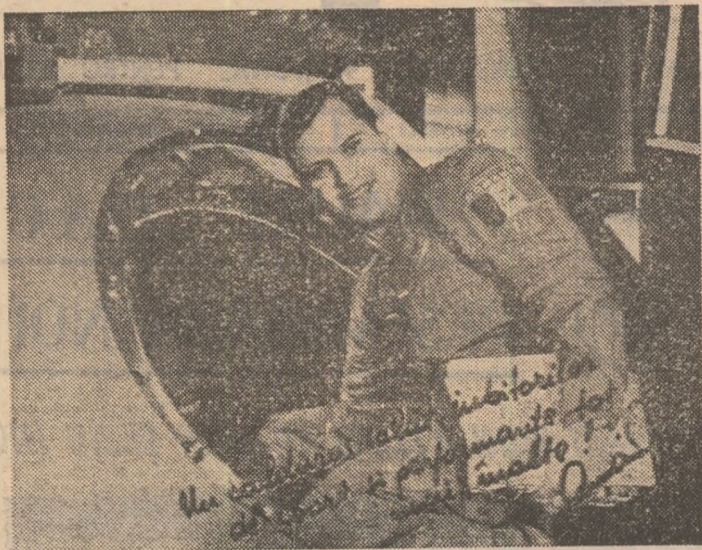
Dumitru Prunariu, lângă nava cu care a călătorit spre stele

Pășim alături pe cărarea umbrărită de crengile fagilor, din Poiana Brașov. Prin văzduh zboară năframe albe de nori și mai sus un turboreactor înscrie pe cer o diagonală de argint. Omul de lângă mine, un tânăr cu statura unui gimnast vioi și bine dispus, de o amabilitate cuceritoare, omul acesta cu ochii neobișnuit de ageri aruncă o clipă privirea spre pasărea din văzduh. De acolo, de la 9-10 000 de metri, pământul aproape și cerul albastru. Dar de la 380 de mii de metri? Cum se vede? El știe. El a fost acolo. El a avut cinstea de a fi primul român care, continuând glorioasa trajectorie spre stele începută de Vuia, Vlaicu, Coandă, a plonjat în spațiul cosmic. În cadrul programului „Intercosmos” — experimentul științific „Saliut-6” — „Soiuz” — în tandem cu cosmonautul sovietic Leonid Popov. Pășim alături. Căpitanul Dumitru Dorin Prunariu, cel care l-a cucerit prin buna dispoziție românească pe colegii săi din orașelul stelar în timpul pregătirilor. Iar pe examinatori — „cam 60 de specialiști, pe comisiile, de fiecare experiment” — prin scilpitoarea sa inteligență și pregătirea ireproșabilă, preferă să ne vorbească, pentru început, de primii pași spre fantastica eroazieră cosmică.