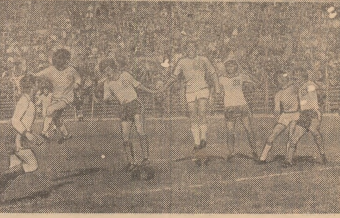
O „horă” formată din șapte jucători în careul echipei Corvinul, care va obține la București, în partida cu Progresul Vulcan, una din surprinzătoarele ei victorii în deplasare.

În retur, echipa sîderurgîștilor a pendulat tot timpul între locurile 5-10, alterînd jocuri de mare eficiență (4-0 cu F.C. Argeș și „Pol” Timișoara, 6-1 cu F.C. Baia Mare, 8-0 cu Politehnica Iași) cu altele în care a rămas datore înfocărilor ei suporterilor (1-2 cu Dinamo, 0-1 cu Jiul, 0-1 cu Sportul studentesc, 1-3 cu „U” Cluj-Napoca). Din această alternanță (a salvat, la un moment dat, o echipă studentescă, pe cea din București, „îngropînd” alta, pe cea din