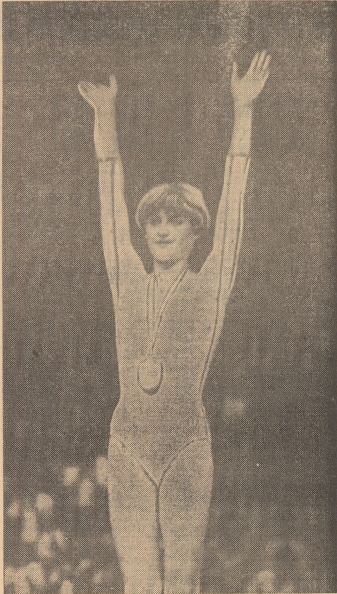
Nadia Comăneci salută publicul, care o aplaudă pentru noua sa performanță