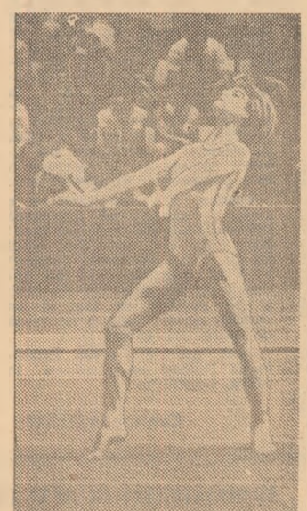
Nadia Comănești în timpul „solului” notat cu 10

Concentrați asupra disputei dintre selecționatele României și Uniunii Sovietice, spectatorii au urmărit poate mai puțin alte două echipe, cele ale R. P.