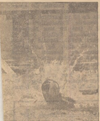
Io România — Canada

nu numai să opună o rezistență dîrză, dar și să atace în erie, reușînd să preia conducerea în prima repriză. Echipa noastră, însă, și-a revenit repede și profitînd că jucătorii aspeți încep să comită neregularități tot mai dese obține două lovituri de la 4 m pe care Hagiu le transformă cu precizie. Punînd stăpînire pe joc în cea de-a treia repriză, ploștii români se dezlanțue, ferînd un final de meci decît de spectaculos. Japonezii i toate insistența lor, nu mai pot să mai încheie nici un gol. Scori punctelor: Hagiu 4,