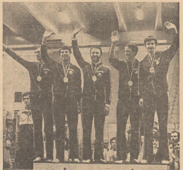
Echipa română de spadă salutînd publicul de pe cea mai înaltă treaptă a podiumului (Cronica în pag. a 3-a)