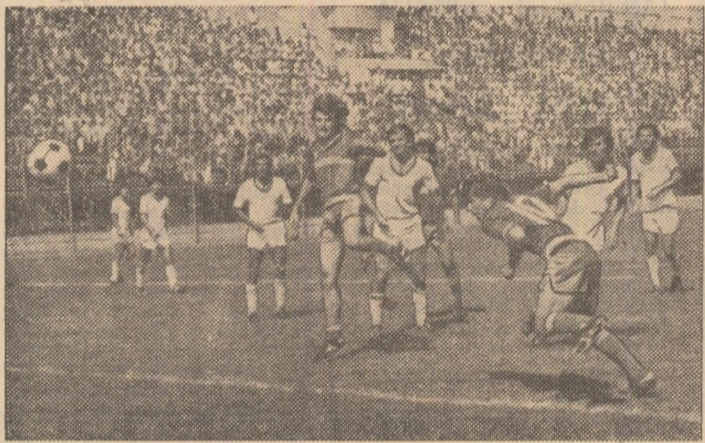
O secvență din meciul Progresul Vulcan — Mecanică fină, disputat duminică dimineață pe stadionul Giulești, în cadrul „Cupei Eliberării”