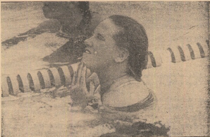
În prim plan, recordmana lumii în proba de 1500 m liber, Kim Linehan (S.U.A.), una dintre marile vedete ale Universiadei — trei medalii de aur