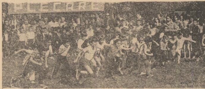
Moment inedit în programul festivității de deschidere a noului an sportiv școlar, alergarea de cros a șoimilor patriei...

Intr-o ambianță cuceritoare — cu mult soare, ca în plină vară, și cu un public entuziast — elevii Capitalei au participat, duminică dimineață, pe Stadionul tineretului, la deschiderea anului sportiv școlar. Evenimentul marchează — prin tradiție — startul într-o multitudine de concursuri și competiții organizate în cadrul „Daciadei”