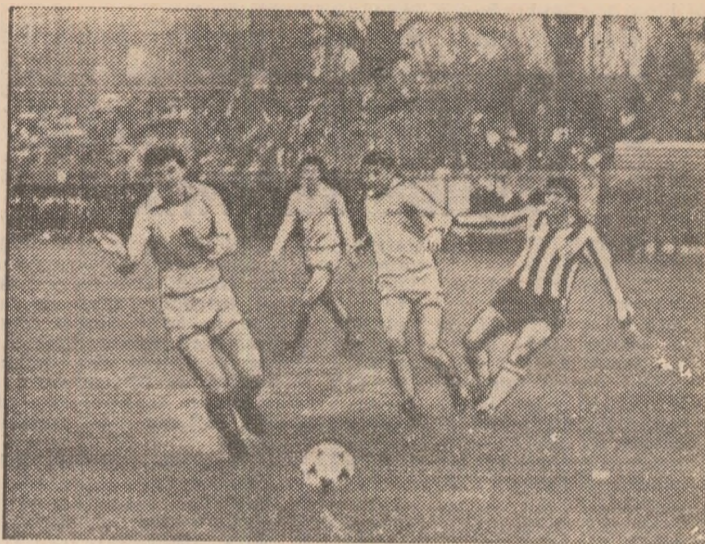
Dubinciu, Rednic, Nișca — în urmărirea lui Munteanu II sau apărarea hunedoreană, la post. (Fază din meciul Sportul studențesc — Corvinul).