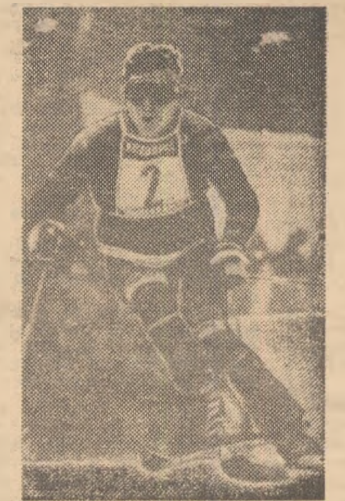
Liderul „Cupel Mondiale”, schiorul american Phil Mahre, în turezul unei curse de slalom

La Garmisch Partenkirchen (R.F.G.), în meci tur pentru sferturile de finală ale „Cupel campionilor europeni” la hochei pe gheață, echipa S.C. Riessersee a învins cu scorul de 7-4 (3-2, 4-0, 0-2) formația suedeză BK Faerestads.