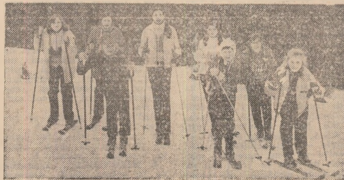
● Inițiativă care ar putea fi extinsă: inițierea în schi

Sînt începuturi, firește, și încă nu se poate vorbi de o reală cuprindere a masei de femei din căminele de nefamiliste la viața sportivă. În multe alte județe, însă — după cum reiese din datele existente la Comisia centrală — acțiunea demarează greu, uneori