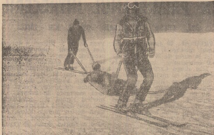
Cea mai grea — dar și mai spectaculoasă probă — este transportarea „rănitului” ca akja. Iată unul dintre echipaje, gata de start...