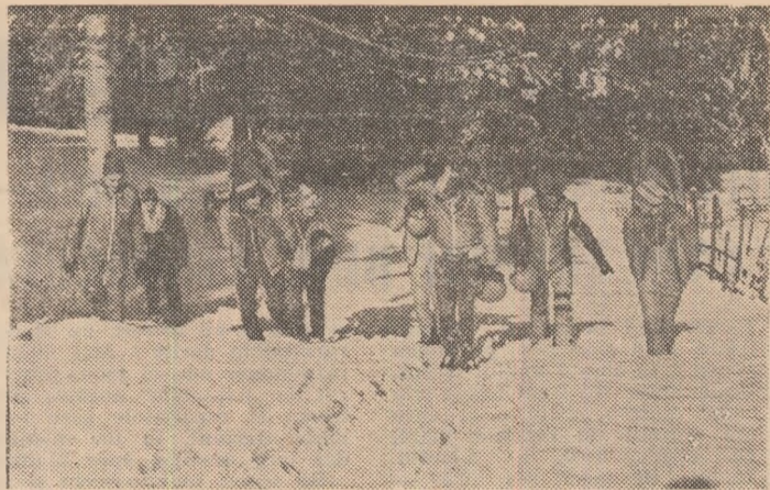
Sănități de la A.S. „Bradul“ (U.F.E.T. — Vatra Dornei) urcînd spre pîrte, pentru un antrenament

— Păi, dacă nu lasi omul să vorbească! De întrecerile zilnice de la ora 15 ti-am vorbit! Dar de?... Vasile TOFAN