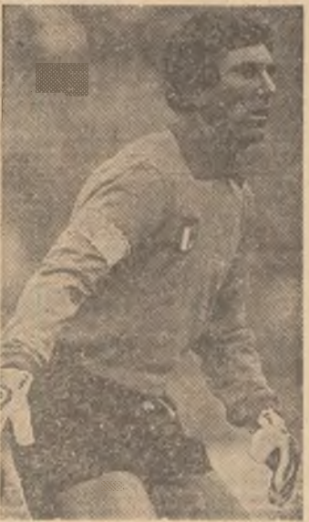
Dino Zoff (Juventus Torino) va implini la 28 februarie 40 de ani! Va mai apăra poarta Italiei și în noua ediție a C.E.?

Din capul locului trebuie să apreciem că prin prisma rezultatelor din preliminariile C.M., a unor declarații făcute de antrenorii sau comentarii ale presei, situația „marilor favorite” din această grupă a 5-a nu este atât de ușoară pe cât s-ar crede la prima vedere. Putem spune chiar că lupta pentru primul loc rămâne deschisă între patru echipe! Desigur, unele reprezentative (Italia și Cehoslovacia) își pot schimba efectivele după turneul final al C.M., în funcție de prestația lor la marea competiție din Spania. Să analizăm pe scurt pe cele „trei mari adversare” ale selecționatei noastre.