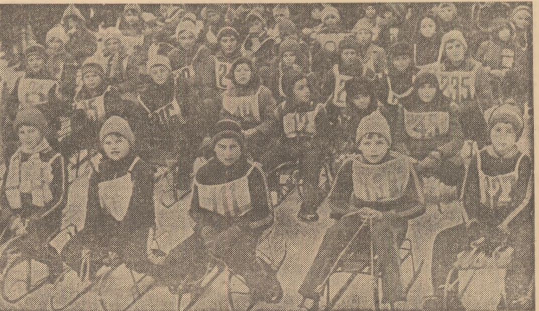
Un concurs sătesc de sanie în județul Suceava

sportiv cuprinzînd terenuri de handbal, baschet, tenis de cîmp, imprevizibil, asfaltat, dotat chiar și cu instalație electrică pentru nocturnă. Activitatea sportivă de aici? Pentru atletism, handbal și fotbal, de pildă, se organizează în cadrul „Dacia-dei“ competiții locale pe durata întregului an. Interesante, mult apreciate sînt ser-