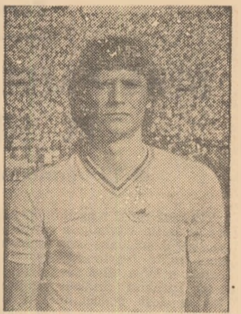
didaturi ca pînă acum — în campionatul Europei, ediția 1981.

— Și cu Dinamo, în competițiile europene de club, și cu echipa națională — unde cred că vom avea mai multe can-