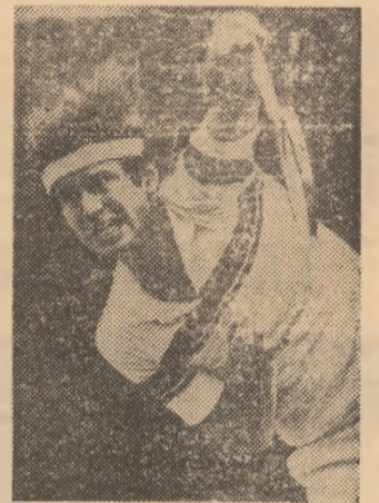
John McEnroe (S.U.A.) laureatul sezonului internațional de tenis '81

mondial al terenurilor cu zgură, confirmat pentru a 6-a oară (!) la Roland Garros, ca și cele două mari finale pierdute. Cel de al doilea, într-o impresionantă ascensiune, a avut un finis excepțional, cu 35 partide cîștigate consecutiv în turneele Marelui Premiu, pe care îl încheie victorios la mare distanță de puncte (1. Lendl 2413 p., 2. McEnroe 2095 p., 3. Connors 1717 p.). Nu numai atât. Ivan Lendl realizează și „eventul” Marelui Premiu FILT — Turneul campionilor, triumfînd la Madison Square Garden, cu ultimele două meciuri cîștigate în fața localnicilor McEnroe și Gerulaitis. O reeditare parțială a acelei performan-