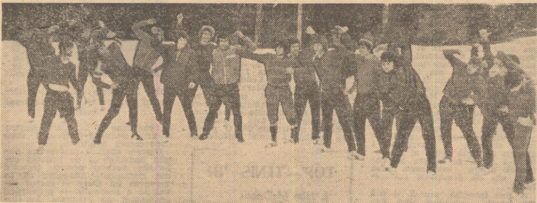
Dinamoviștii la ora clasicei încălziri...