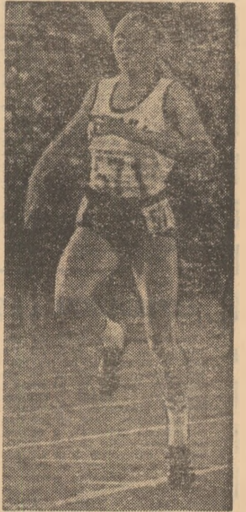
Doina Melinte confirmă ascensiunea în elita mondială a probei de 800 m