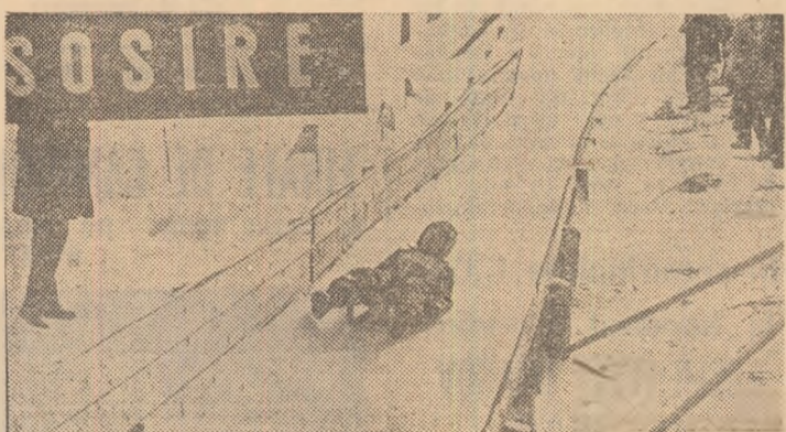
Coborîre vijelioasă pe pîrtia de sanie din Vatra Dornei, în cadrul „Cupel Pionierul”