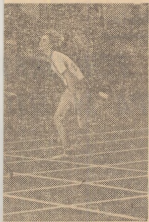
niocarelor la 50 m garduri