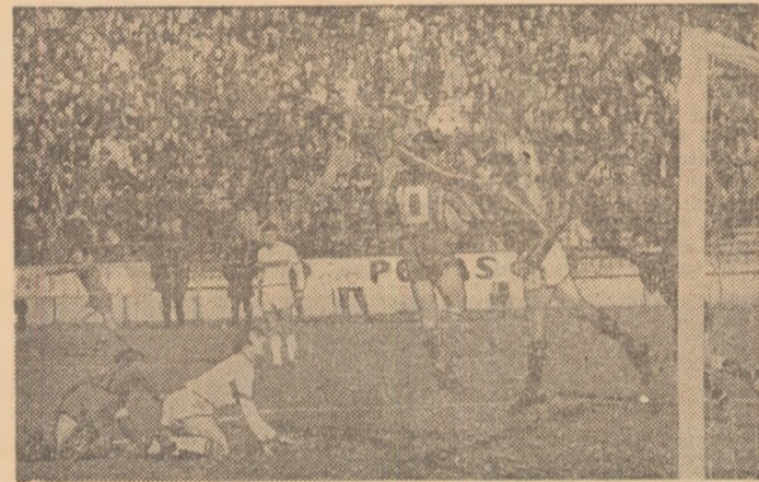
Faza primului gol, cînd balonul, reluat, puternic, cu capul, de Iordănescu, a revenit în teren de sub „transversală”