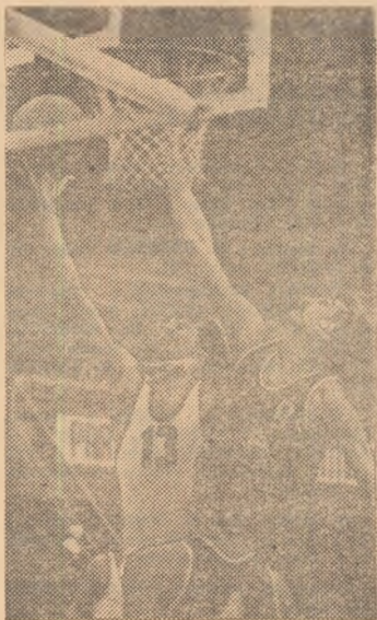
Cei doi „giganți” de la I.C.E.D. și C.S.U. Brașov sub panou... și două puncte pentru echipa bucureșteană