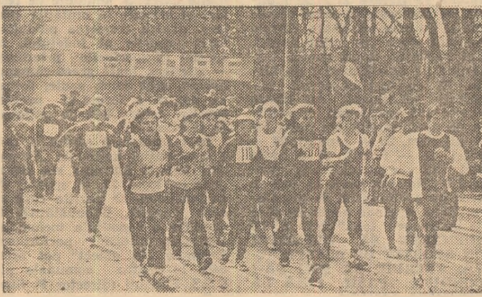
O fotografie document: aspect de la prima competiție oficială de marș feminin organizată în țara noastră. Ea a avut loc duminică, în București, la Șosea, în cadrul primei etape a „Cupei primăverii” (amănunte în pag. a 2-a)

Această partidă de verificare va fi condusă de o brigadă de arbitri avîndu-l la centru pe D. Petrescu, iar la linie pe P. Secleanu și M. Huștiuc, toți trei din Capitală.