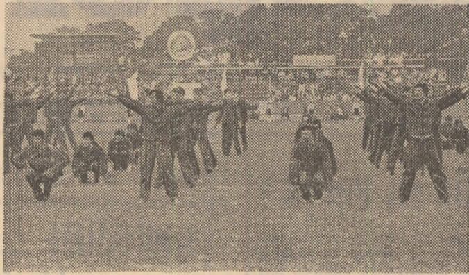
Gimnastica — disciplina accesibilă tuturor