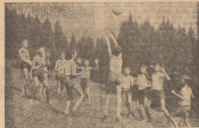
Mișcarea în aer liber, practicarea sporturilor preferate se numără — firește — printre marile bucurii ale vacanței!

223 DE INVITATII PENTRU ELEVII VASLULUI în tot atitea cluburi de vacanță. După cum aflăm de la C.J.O.P., se evidențiază, printr-un bogat program al activităților sportive, cluburile de la școlile generale 3 Vaslui, 5 Hîuși, 8 Birlad, din comunele Vulturești, Codăiești, Pogana, Ivănești, Crețești și Murgeni.