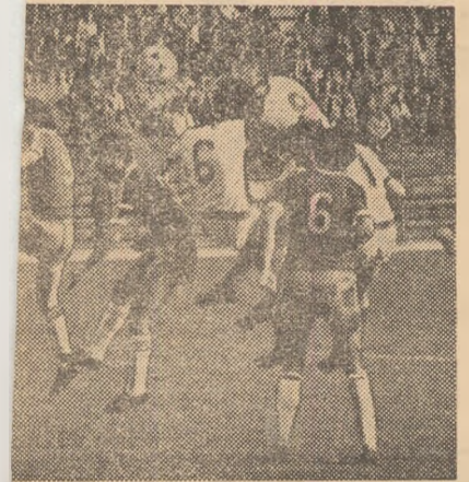
treul Chimiei și un nou atac al gazvilcei. Fază din meciul Progresul-Vilcea.

TENIS ● Turneul de la Gstaad: Vilas — Vanier 6-3, 6-4, Ilie Năstase — Stan Smith 6-1, 2-6, 6-0, Clerc — Garriker 6-3, 6-1, Gunthardt — Borowiak 6-2, 6-1, Pecci — Gomez 6-1, 6-7, 7-6 ● Cupa Annie Soisbault (echipe feminine) R.F.G. — Norvegia 3-0, în grupa de la Karlovy Vary Italia — Ungaria 3-0 și Iugoslavia — Argentina 3-0 în grupa de la Veneția ● Cupa Galea (juniori), la Salonic: Mexic — Grecia 3-1, Mexic — U.R.S.S. 4-0 ● Sferturi de finală în Cupa Davis (9-11 iulie): S.U.A. — Suedia (St. Louis), Australia — Chile (Brisbane), Italia — Noua Zeelandă (Ravenna), Franța — Cehoslovacia (Paris); zona europeană „A” (semifinale): Irlanda — Finlanda, Elveția — Austria (amînat 6-8 august) și zona „B”: Ungaria — Israel, Danemarca — Egipt.