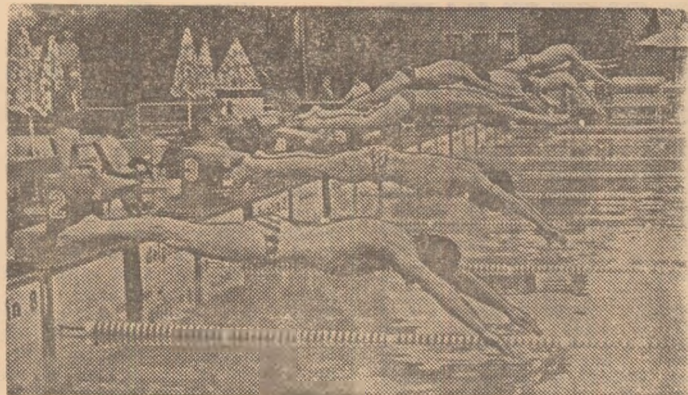
Unul din starturile probei de natație din cadrul campionatelor internaționale de pentatlon

priu-zisă a oferit un cadru adecvat pentru răspunsuri competente la aceste întrebări, pentru că forța echipelor participante la competiție a fost