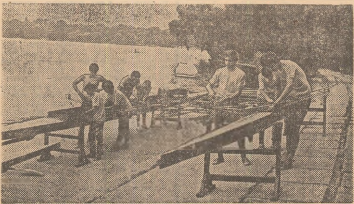
Pe lacul Herăstrău, la baza nautică a C.S.S. nr. 1 București, elevii-performeri au ca preocupare, în aceste zile, nu doar antrenamentele în vederea viitoarelor competiții, ci și — lucru esențial — întreținerea ambarcațiunilor și, dacă este cazul, chiar efectuarea de mici reparații.