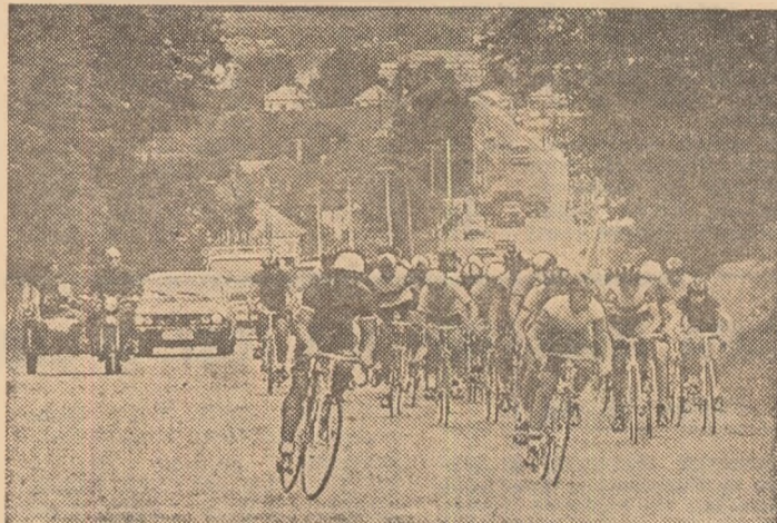
Juniorii rulează puternic pe o porțiune de urcuș în proba de fond.

Atît întrecerile juniorilor (simbătă) cit și cele ale seniorilor (duminică) s-au desfășurat pe traseul Cimpulung — Dragoslavele — Rucăr — Bran, primul parcîrînd 90 km, iar cellalți 118 km. Un traseu montan selectiv, pe care oaspeții l-au apreciat drept excelent pentru trierea valorilor. Duminică, dificultățile au crescut simțitor, ploaia făcînd periculoasă coborîrea pe serpentine. Spre lauda lor, concurenții nu s-au angajat în busculade, abandonanți (2 juniori 7 seniori) avînd drept explicație doar epuizarea forțelor.