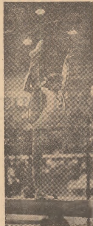
Alduri de Cristina Grigoras, Lavinia Agache, Mihaela Stănuț și de alte gimnaste de frunte ale țării, Ecaterina Szabo promite să devină una din componentele de bază ale viitoarei reprezentative feminine

Școala românească de gimnastică s-a impus viguros pe plan internațional prin îndrăzneala cu care a promovat și consolidat o nouă concepție privind selecția și pregătirea