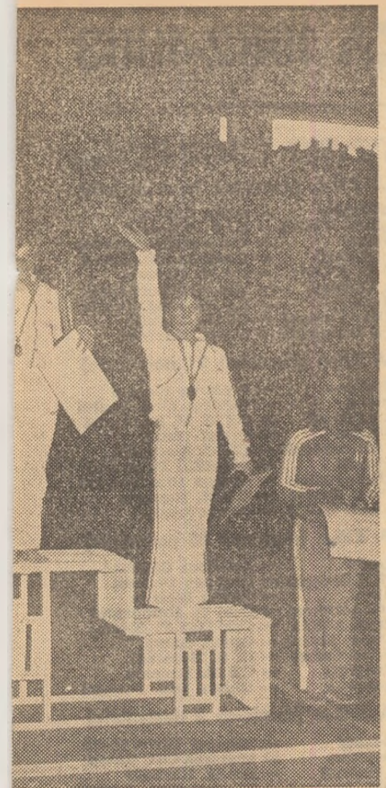
gimnastica noastră, pe care am dori să mai des și la competiții de valoare mondială de premiere — trei gimnaste române: trei locuri la Campionatele internaționale din PARASCHIVESCU — Rm. Vilcea

sino- sunt foarte „receptive” tocmai la asemenea exerciții. Știm că nu este deloc ușor să revenim pe „podiumul mondial”, acolo unde gimnastica noastră s-a aflat ani în șir, dar știm la fel de bine că avem marea forță umană valoroasă, un cadru organizatoric corespunzător, care ne asigură condiții pentru a ne atinge obiectivele propuse. La Deva, Onești, Sibiu, Constanța, Baia Mare, București, Arad, Focșani, Galați, Bacău există numeroși tehnicieni înimoși și un mare număr de sportive și sportivi talentați, care nu preocupă nici un efort pentru ridicarea continuă a nivelului competițional al gimnasticii noastre feminine și masculine. Rezultatele obținute recent la două mari întreceri de tradiție, respectiv campionatele europene de juniori și „Cupa Prietenia”, ne stimulează în pregătirile viitoare și ne dau încredere. Mi se pare necesar să subliniez că și în gimnastica masculină sînt semne vizibile că munca depusă în unele centre precum București, Brașov, Sibiu, Regiștea va da în curînd roade. În aceste localități au apărut numeroși gimnaști valoroși, de perspectivă, dintre care unii s-au și afirmat în întreceri internaționale fapt ce ne arată că trebuie întreprinse măsuri pentru lărgirea continuă a bazei de masă a acestei discipline.