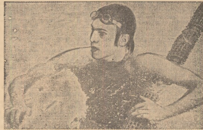
Vladimir Salnikov, unul din favoriți în proba de 800 m liber a „mondialelor” de la Guayaquil.

urmă cu doi ani, a surprins pe majoritatea specialiștilor, știut fi-înd faptul că natația ecuadoriană se află încă în stadiul de pion-ierat. Dealtfel, gazdele nu vor participa decît cu cîțiva înotători și doi săritori de la trambulină... Inițial, la Congresul desfășurat în 1978, în Berlinul Occidental, or-ganizarea competiției fusese în-credințată S.U.A. Dar, pe rînd, Santa Clara și apoi Concorde,