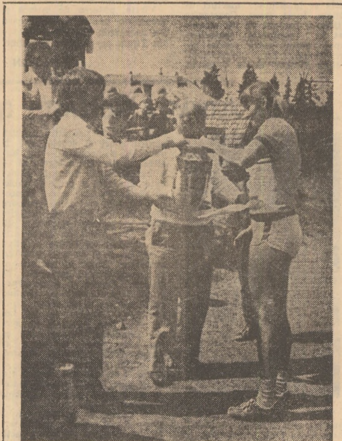
În întreaga țară au loc ample manifestații sportive de masă în cadrul competiției naționale „DACIADA”, dotate cu trofee care răsplătesc pe cei mai buni dintre competitori.

Iată-ne la punctul terminus al raidului, tabăra din Predeal. Și aici liniște desăvîrșită. Intregul efectiv, 212 pionieri din Năvodari și Medgidia, marea lor majoritate luînd contact pentru prima oară cu... muntele adevărat, a plecat în această dimineață cu trenul spre Bușteni și de acolo... în București. Se poate imagina ușor ce amintiri au rămas acestor pionieri din județul Constanța despre frumusețile Bucegilor. Cu același entuziasm se participă la activitatea culturală, ca și la întrecerile sportive: tenis de masă, șah, orientare turistică, cros și jos în poleiță, fotbal.