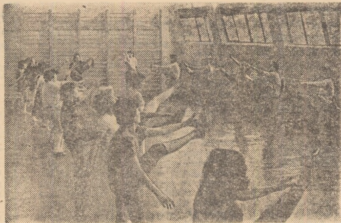
În noua sală de la complexul Progresul — oră la centrul de întreținere.