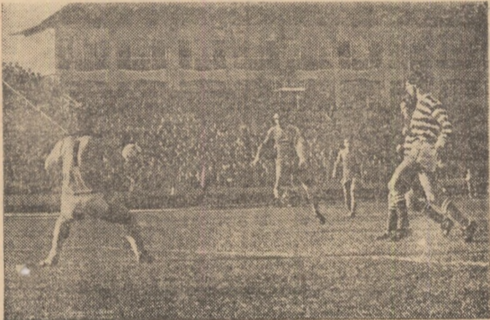
Cirjur încheie seria celor trei goluri printr-un șut sec. (Fază din meciul Universitatea Craiova - Shamrock Rovers 3-0)