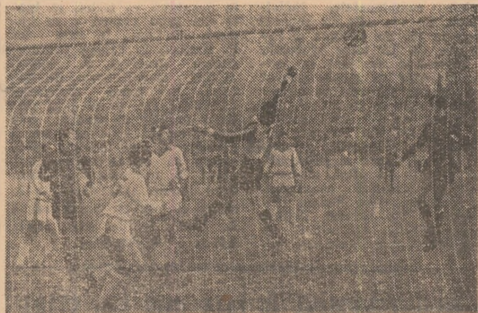
Portarul dinamovist pus la grea încercare de atacanții formației Steaua (echipament închis).