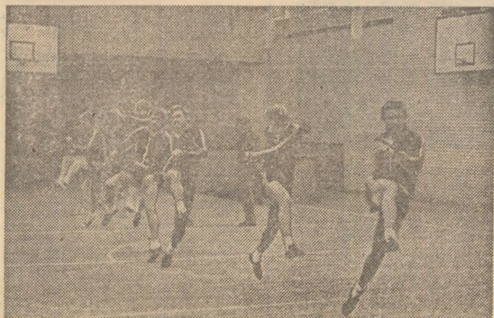
O „încălzire” bine făcută va da poftă de joacă „alb-negrilor” în miuța lor de 6—6...