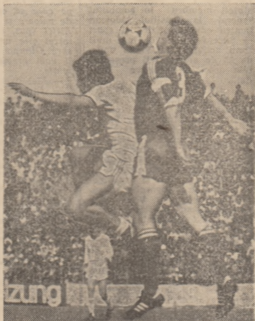
Cămătaru — Briegel, un duel de atac oltean a „punctat” mai mult