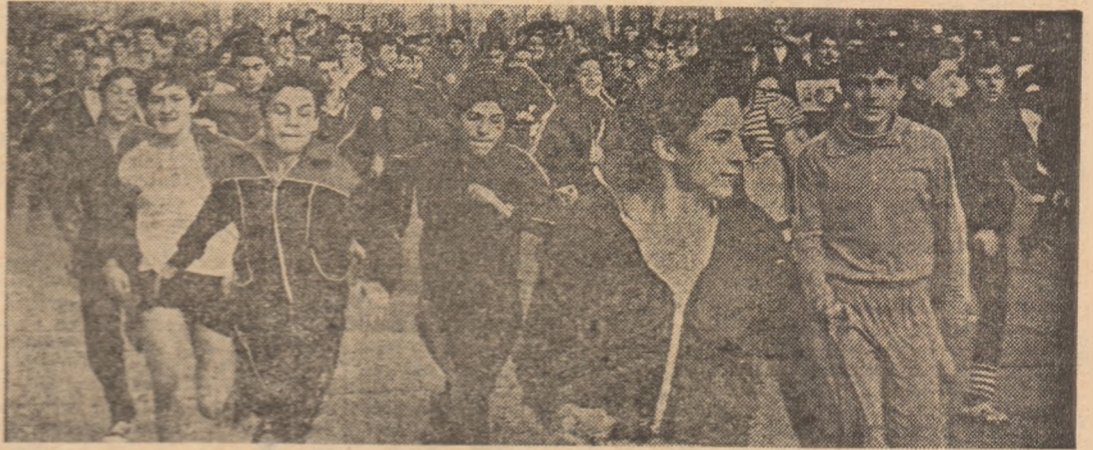
Dintre mii de copii și tineri care participă cu regularitate la crosurile de masă trebuie găsiți viitorii performeri la această probă.

În pagina de față vă prezentăm câteva aspecte semnificative.