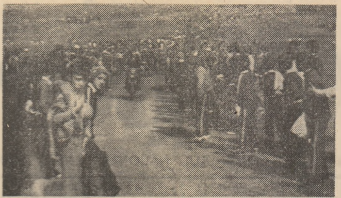
Instantanee de la demonstrațiile de motociclism ale pionierilor.

Demnă de toată lauda este drumetia organizată, la fiecare sfîrșit de an, sub genericul „La