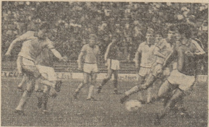
O fază de atac (Cîrțu șutează), dar fără rezultat ca și în alte ocazii.