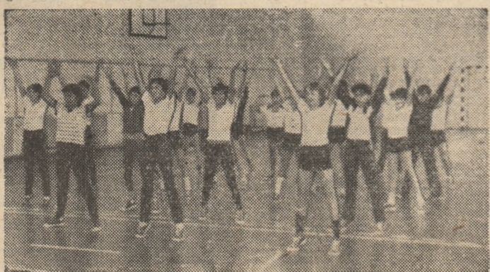
Elevi din Singiorgiu, la ora de educație fizică în noua sală de sport.