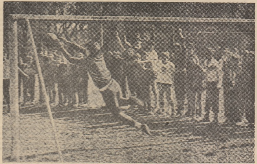
Pentru stabilirea învingătoare, se execută o serie de penalty-uri, portarul de la „generală 5” fiind aplaudat pentru această spectaculoasă paradă