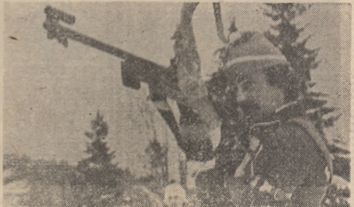
Vladimir Todașcă, cîștigătorul cursei de 20 km