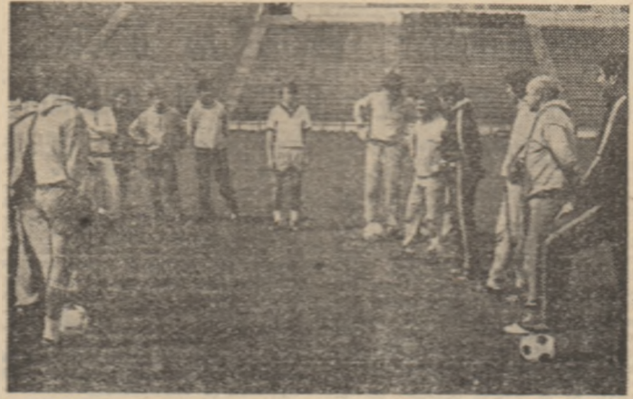
Tricolorii ascultă tema ședinței de pregătire desfășurată ieri dimineață pe stadionul Steaua

Așteptăm replica admirabililor pasionați bucureșteni al fotbalului, un public cu adevărat reprezentativ, reunit în această seară pe stadionul „23 August”. INTR-O INIMĂ ȘI INTR-UN GIND ZECILE DE MII DE SPECTATORI TREBUIE SĂ FIE ASTĂZI LÎNGĂ ECHIPA NAȚIONALĂ DIN PRIMUL ȘI PÎNĂ ÎN ULTIMUL MINUT INCURAJĂ ÎNTR-O FĂRĂ ÎNCETARE: HAIDE, ROMÂNIA; HAI, TRICOLORI!