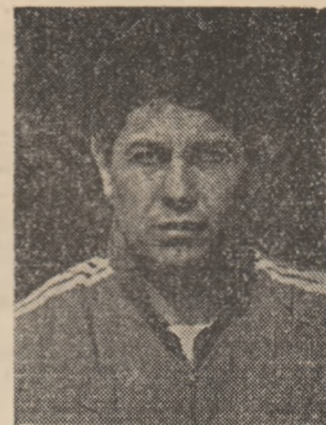
MIRCEA LUCESCU: „Vom arunca în luptă toate forțele pentru a pune în aplicare tot ce știm!”

IERI DUPĂ-AMIAZĂ, întîlnire cu fotbalistii italieni la stadionul „23 August”. La ora 16,10, antrenorul secund Cesare Maldini a condus o ședință de pregătire, cu o durată de o oră, la care au participat toți componenții lotului. Antrenamentul a debutat cu o ușoară încălzire, după care s-a trecut la execuții de pase, alternate cu sprinturi scurte. Odată cu trecerea la partea a doua a antrenamentului, o „miuță”, pe lățimile terenului, cu două echipe ad-hoc, alcătuite din componenții lotului prezent, „albii” contra „albaștrii”, și-a făcut apariția și Enzo Bearzot și în timp ce se întreținea cu ziaristii își mai arunca câte o privire și la ceea ce se petrecea pe gazon, unde jucătorii italieni s-au angajat, timp de o jumătate de oră, într-o dispută cu un tempo susținut.