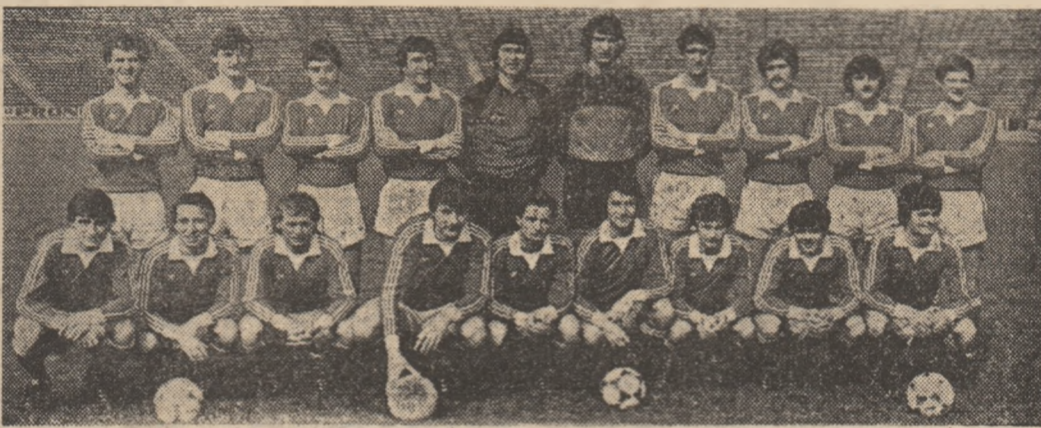
Componenții lotului de fotbal al României pentru meciul de astăzi

Ultimele pregătiri pentru „marea nocturnă”