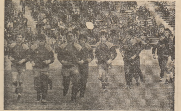
Fotbaliștii italieni, la antrenamentul de ieri după-amiază de pe stadionul „23 August”

gresul echipei noastre reprezentative, al formațiilor românești. „O reprezentativă care beneficiază de blocul Universității Craiova, foarte aproape, după părerea mea, de câștigarea Cupei U.E.F.A., pornește de la o omogenitate de joc și un moral remarcabile” — ne declara antrenorul Enzo Bearzot. Tardelli, de mulți considerat omul nr. 1 al succesului mondial, socotește că „întîlnirea va fi extrem de grea pentru noi, deoarece echipa României a crescut considerabil sub toate aspectele”. În această dispută așa de echilibrată, asemenea unei curse atletice în care concurenții au performanțe despartite doar de zecimi de secundă, un rol decisiv revine MARRELUI JUCĂTOR NOSTRU PUBLICUL. Echipa noastră trebuie să se simtă cu adevărat acasă. Zecile de mii de spectatori de pe stadionul „23 August” pot și trebuie să fie al 12-lea component al naționalei. Ei au un minunat exemplu în comportarea entuziasată, dar plină de răbdare și înțelegere (golul victoriei poate veni și în ultimele minute de joc) demonstrată de publicul craiovean.