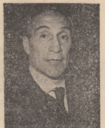
ENZO BEARZOT: „Pentru noi, meciul cu echipa României înseamnă ultimul tren pentru... Paris!”

Încă un tînăr tenisman român începe să se afirme