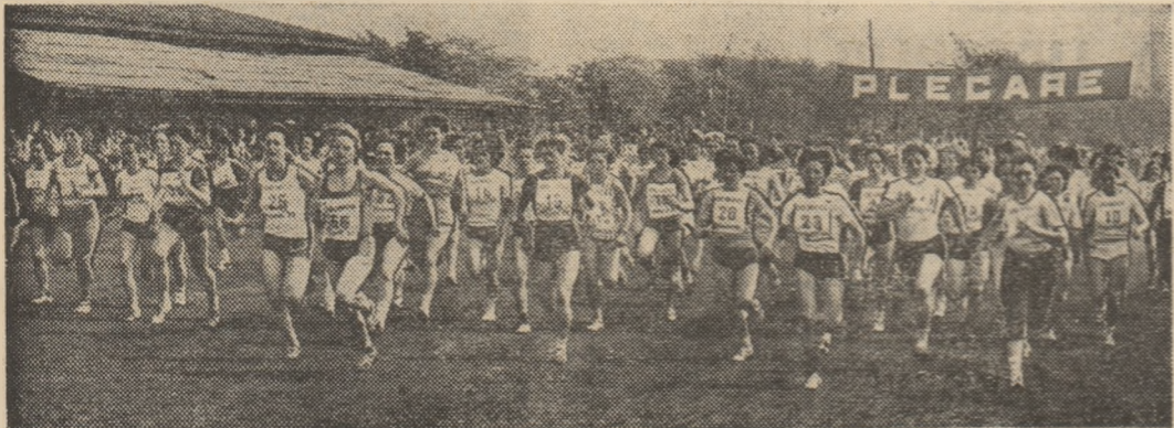
La recente finale ale „Crosului tineretului“ au participat (cat. peste 19 ani) numeroase tinere muncitoare din toate județele țării.

București își vor închipui ce a fost aici cu 10 ani în urmă? O groapă de gunoaie, o baltă în care se zbuguiau broaștele. Și acum? Vă spunem noi: un teren de fotbal al cărui gazon, făcut din brazdă lângă brazdă, așteaptă să prindă... rădăcini, terenuri de tenis de cimp, de handbal, de volei, sală de tenis de masă.