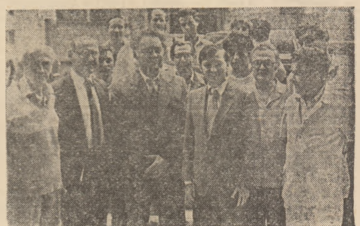
Campionul mondial Anatoli Karpov, în mijlocul unui grup de iubitori ai șahului, avînd alături pe vechiul său adversar în concursuri și prieten, marele maestru Victor Ciocăltea, la sosirea sa în Capitală.

Se înșală cei care și închipuie că un campion mondial de șah trebuie să arate neapărat ca un venerabil profesor, sau un mare șef de laborator, copleșit parcă de nolanul formulelor pe care le cal-