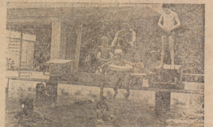
Primul... pas în bazin e mai greu. Trebuie curaj, trebuie și colac. La început, Curind, acești copii vor deprinde — în cazul de față la bazinul bucureștean „23 August”, dar și în altele alte locuri din Capitală sau din țară — tainele plutirii pe apă. Și, cine știe, poate că dintre ei se vor alege, mine, viitorii performeri...

vor avea loc între 2 și 9 septembrie la București, pe poligonul Tunari. Totodată, și-au exprimat intenția de a participa la acest eveniment deosebit o seamă de personalități marcante ale tirului internațional.