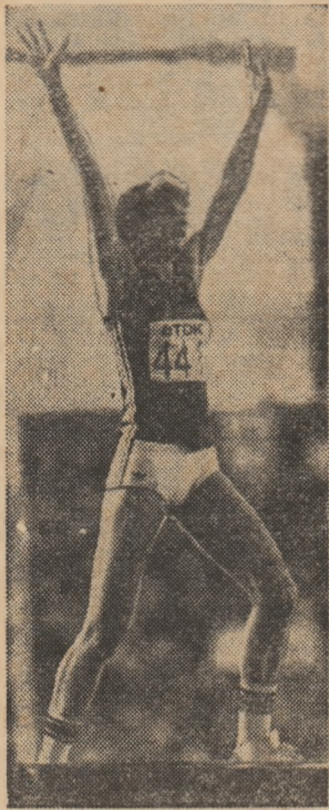
Sovietica Tamara Bikova, prima campioană mondială a săriturii în înălțime, sau bucuria victoriei...