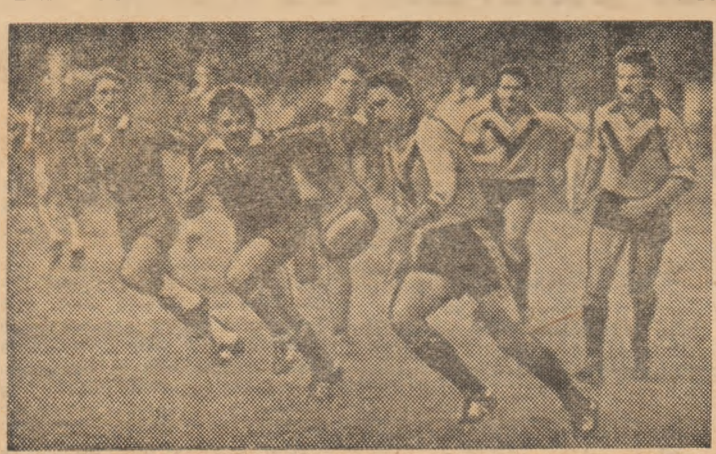
La reluarea contactului cu Divizia „A”, echipa Vulcan s-a comportat bine. Iată-o atacînd, în partida cu Rapid, prin învîduire.

La startul celui de al 61-lea campionat de rugby s-au aliniat 20 de echipe (cifra record!), ceea ce probează continuu răspîndire în teritoriu a sportului cu balonul oval. Iată amănunte de la partidele primei etape.