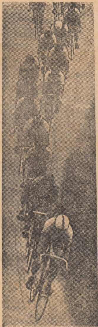
Aspect din timpul desfășurării probei cu adițiune de puncte — seniori.

Simbătă urmărirea pe echipe, 4000 m seniori, s-a încheiat cu victoria formației Dinamo I (Romașcanu, Mitu, Lăutaru, Mitrache), care a acoperit distanța în 4:35,9. În serii, concursul fără adversar, aceeași formație a realizat 4:35,4, un