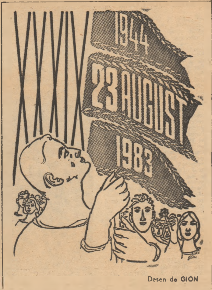
Desen de GION