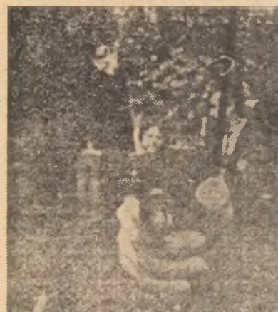
Titlul continental obținut la București pentru o medalie și la Jocurile