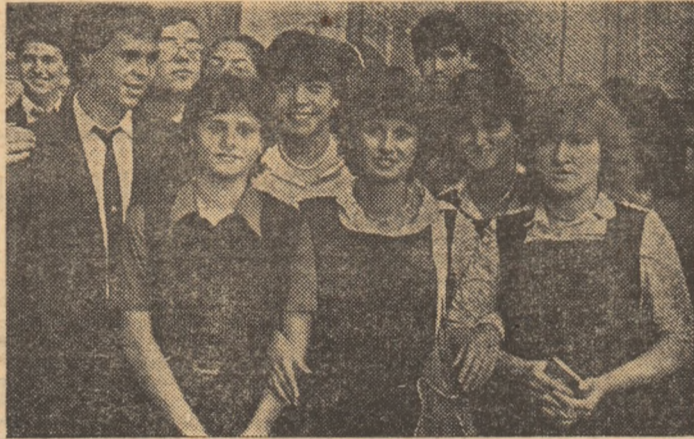
Prima zi din noul an școlar la Liceul nr. 37, școala unde învață mulți sportivi de performanță.