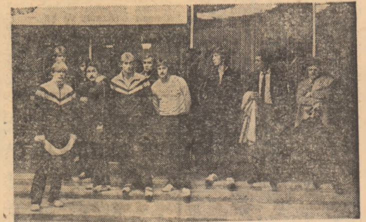
Jucătorii vest-germani, în fața hotelului „Intercontinental”, gata de plecare la antrenament

săi un antrenament de 60 de minute la lumina reflectoarelor stadionului „23 August”, după care ne-a comunicat formația probabilă lat-o: Stein — Kaltz, Hieronymus, Jakobs, Schroder — Hartwig, Rolf, Groh, Magath — Schatzneider, Milewski.