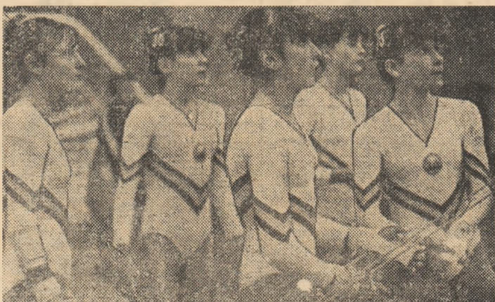
La concursul demonstrativ de la Oradea, componentele echipei reprezentative pregătesc evoluția la paraiele.

Campioanele europene Ecaterina Szabo și Lavinia Agache, printre favoritele la aparate