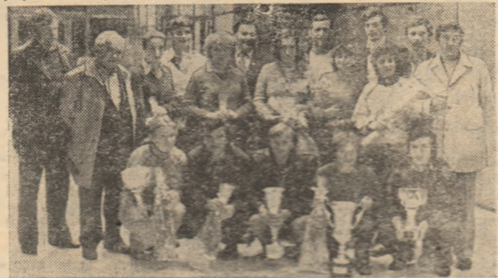
Campionii europeni cu trofeele cucerite, imediat după sosirea pe aeroportul Otopeni.

că eu voi deveni, să zic așa, record-mana competiției. Mi-au ieșit loviturile mai bine decît credeam”. În schimb, principalul realizator al echipei Aurul Baia Mare, ing. Iuliu Bice, era puțin afectat, deoarece i-ar