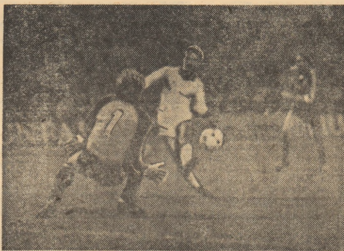
3-0! Orac a interceptat balonul și a șutat!

Jocul a început sub semnul echilibrului, primele 20 de minute lăsându-ne impresia că