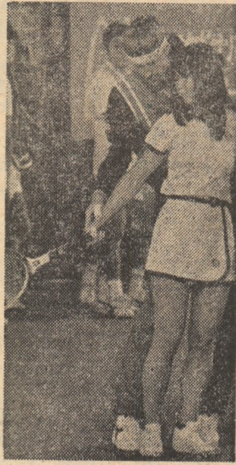
Bjorn Borg în timpul unei lecții practice, la Tokio.

LA TOKIO, SPERANȚELE TENISULUI NIPON au fost reunite pentru un stagiu de pregătire condus de marele jucător suedez Bjorn Borg. El le-a dezvăluit acestora unele din secretele reușitei în tenis, sport alit de frumos, dar și alit de pretentios... (R. VILARA)