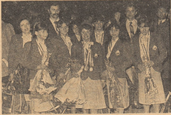
A doua echipă din lume, tină și talentată, o echipă pentru Azi și pentru... Miine!

Componentele unei echipe care e a doua in lume au devenit, nu-i așa, vrednice vedete ale sportului. Dar, văzându-