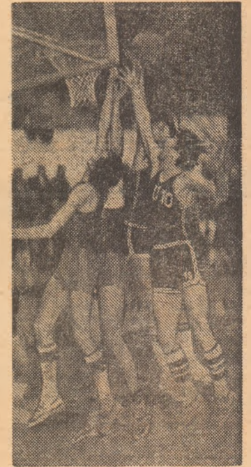
Baschetbalistii de la „U” au dominat lupta sub panou în meciul cu Dinamo

Turneul de la Rimnicu Vilcea este cea mai importantă întrecere de pînă acum din ediția a 35-a a campionatului național de baschet feminin. În acest al treilea turneu al Di-