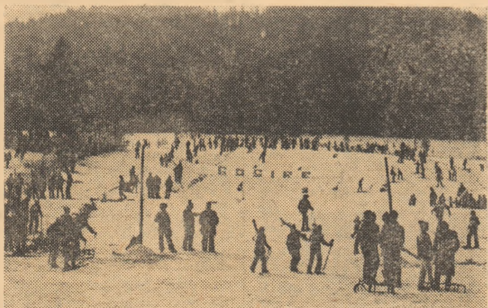
În fiecare an, pe masivul Runc de la Cimpulung Moldovenesc, sute de schiori și practicanți ai săniușului se întilnesc în concursurile din cadrul „Daciadei”. Așa va fi și peste puțin timp, cînd pîrtia va putca fi și ea gata de start

E diția de iarnă a „Daciadei” a debutat la Iași cu ample întreceri la care au participat mii de tineri din cele mai diverse unități ale localităților urbane și de la sate. Startul marilor competiții a umplut toate bazele sportive din județ cu numeroși amatori de practicare a exercitiului fizic și sportului. Cu acest prilej au ieșit în evidență, prin buna organizare și mobilizare la întreceri, asociațiile sportive Voința Terom, Tesătura, cele ale școlilor generale 9, 2, 16, 21, 25, 37 și ale liceelor „E. Racoviță”, Pedagogic, Industriale 6 și 2, M.I.U., toate din Iași, în care s-au organizat atractive întreceri la popice, sah, orientare turistică, fotbal, handbal tenis de masă s.a. Două mari crosuri, organizate în Iași („Crosul Păcii” și „Crosul Bobocilor”) au reunit la start peste