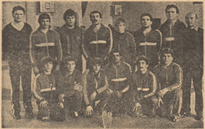
Echipa de lupte libere a clubului Steaua și antrenorii săi, la citeva minute după festivitatea de premiere.