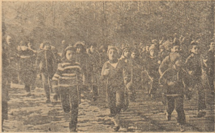
Duminică, în Parcul Tineretului, la atrăgătoarele întreceri de cros doțate cu „Cupa 1 Decembrie”

La turneul final de lupte libere pe categorii de greutate