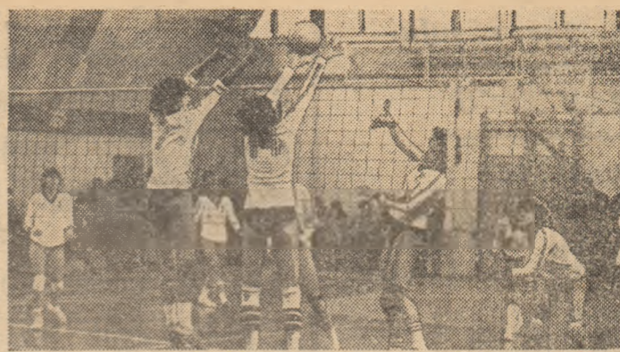
Vicicampiona țării C.S.M. Libertatea Sibiu a avut un start slab în actualul campionat, dar s-a reechilibrat, asaltînd acum pozițiile fruntașe. În imagine sibiencile în atac în meciul cîștigat duminică în Capitală cu Calculatorul. Și azi au prima șansă...